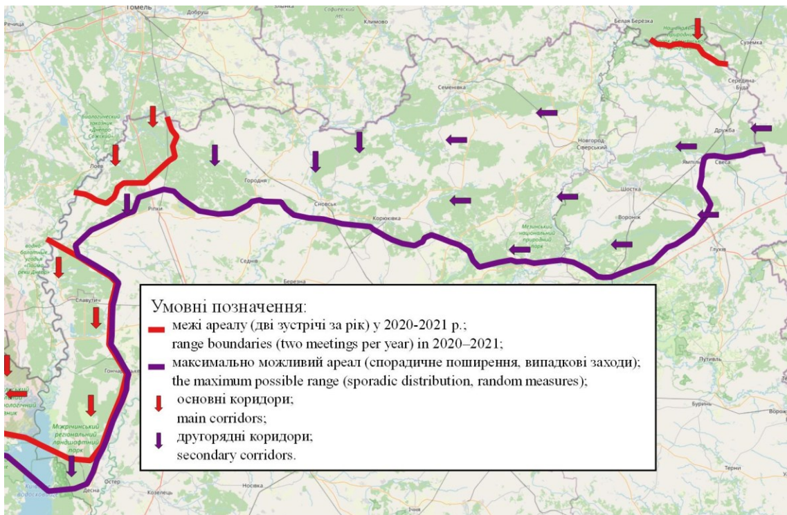
Рис. 14. Межі ареалу 2020-2021 рр. та максимально можливий ареал рисі у Східному Поліссі України. Умовні позначення як на рис. 13.