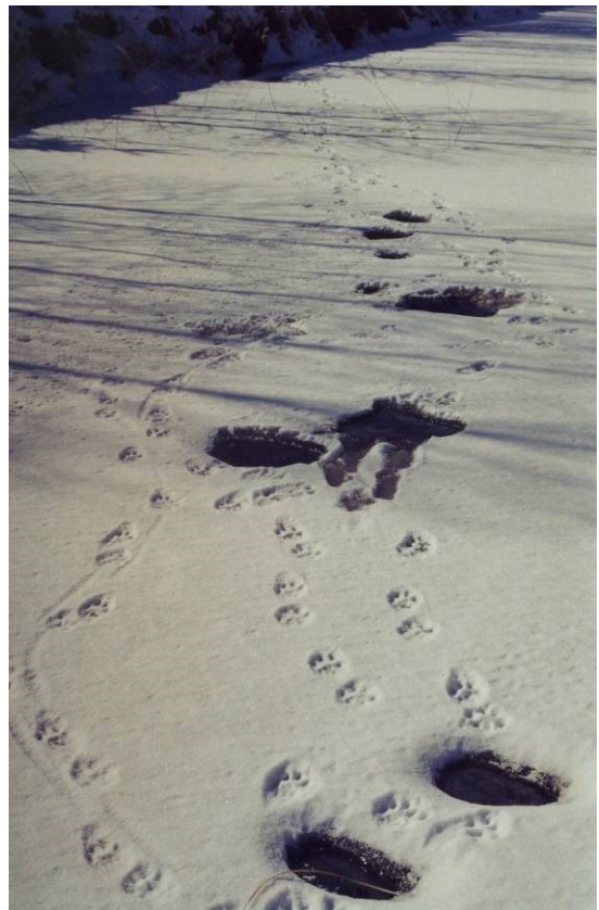
Рис. 9. Сліди самиці рисі з двома молодими на водопой, котрі дають змогу точно встановити чисельний склад групи.

Fig. 8. Mating place of the lynx, which in all cases known to the author took place mainly in the central part of the individual territory of the female. Mapping of the territories of females with broods and establishing distances between their individual sections is an important monitoring information.