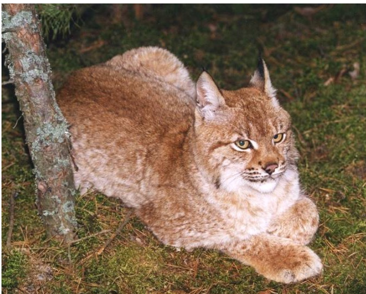
Рис. 12. Типове забарвлення хутра рисі центральної частини поліської популяції, котре не має яскравих плям або має слабку плямистість. Ця обставина ускладнює ідентифікацію окремих особин при фотографуванні фотопастками.

Fig. 11. Brood den of the lynx, well protected from the weather, from which the female managed to evacuate the young before the visit of humans.