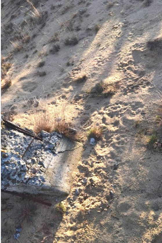
Рис. 6. Деякі бетонні стовпчики особливо інтенсивно мітяться територіальними самцями та самками з виводками. Картування таких міток дає змогу у подальшому порівняно швидко і достовірно встановлювати зайнятість території рисями, встановлювати їх чисельність або їх відсутність.

Fig. 6. Some concrete columns are particularly intensely marked by territorial males and females with broods. Mapping of such marks allows in the future the occupation of the territory of the lynx and their number or absence to be established relatively quickly and reliably.