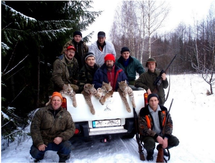
Рис. 15. Проблеми з незаконним добуванням рисі існують не тільки в Україні, але і у ЄС, а особливо у країнах Балтії.

Fig. 15. Problems with illegal rice harvesting exist not only in Ukraine, but also in the EU and especially in the Baltic countries.