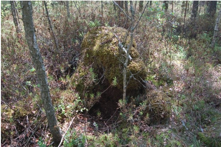
Рис. 11. Виводкове, добре захищене від негоди лігво рисі, з якого самка встигла евакуувати малих до приходу людини.

Fig. 10. Urine in the snow, as a confirmation of leaving an odor mark on the yellowed needles of pinecones. In the snowless period, small dogs that are easy to learn to detect can be used to find such lynx marks. The dog sniffs the lynx urine for a long time and timidly.