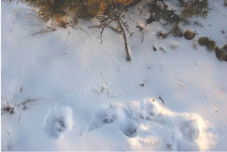
Рис. 10. Сеча на снігу, як підтвердження полишення запахової мітки на пожовклій хвої кущових сосен. У безсніжний період для виявлення таких міток рисі можна використовувати невеликих псів, котрі легко вчаться їх виявляти. Собака довго і боязко обнюхує запах сечі рисі.

Fig. 10. Urine in the snow, as a confirmation of leaving an odor mark on the yellowed needles of pinecones. In the snowless period, small dogs that are easy to learn to detect can be used to find such lynx marks. The dog sniffs the lynx urine for a long time and timidly.