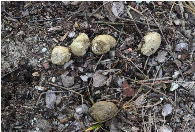
Рис. 1. У більшості випадків знайти екскременти рисі можна від територіальних особин на узбіччях доріг, поблизу маленьких стовпчиків на містках через осушувальні канали. Це найбільш довготривалі в часі ознаки перебування рисі, котрі вимагають спеціального обстеження місць ймовірного маркування місцевості.

З досвіду роботи в Поліссі моніторинг слідової активності та маршрутний облік рисі є більш результативною методикою у випадку, коли до виконання залучаються добре підготовлені виконавці. Особливості мічення території, слідова активність рисі у т. ч. під час копуляції показані на рис. 1–11. Подібна візуальна інформація корисна для підготовки кваліфікованих виконавців робіт з обліку чисельності та моніторингу популяції рисі в Україні.