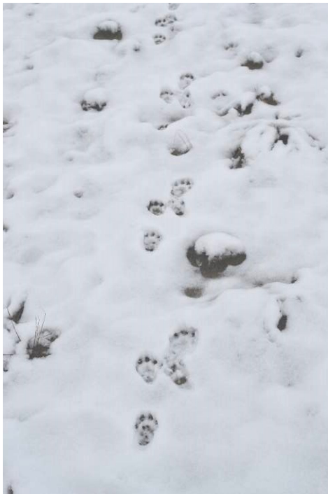
Рис. 2. Сліди молодого рисі, що розселяється. Нетериторіальна особина у шлюбний період (15 лютого — 7 березня) почуває себе наляканою на чужій індивідуальній території і намагається швидко покинути небезпечну зону. Нетериторіальні особини рисі у зимовий позашлюбний період більш спокійно перебувають на індивідуальній території самців.

Fig. 1. In most cases, lynx excrements can be found from territorial individuals on the roadsides, near small columns on bridges through drainage canals. These are the most long-term signs of lynx presence, which require a special examination of the places of probable marking of the area.