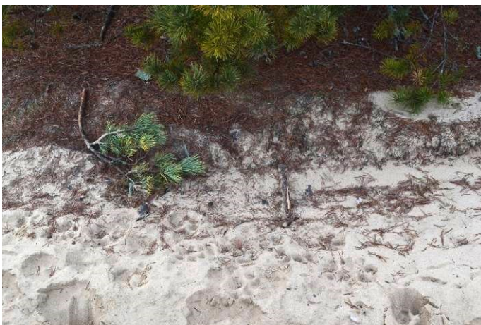
Рис. 7. Найбільш поширена у Поліссі територіальна мітка рисі на проораній трактором мінералізованій смузі (бар'єр для поширення вогню) біля кущової форми сосни з низько опущеною кроною. Рисі для переходів часто використовують такі смуги.

Fig. 6. Some concrete columns are particularly intensely marked by territorial males and females with broods. Mapping of such marks allows in the future the occupation of the territory of the lynx and their number or absence to be established relatively quickly and reliably.