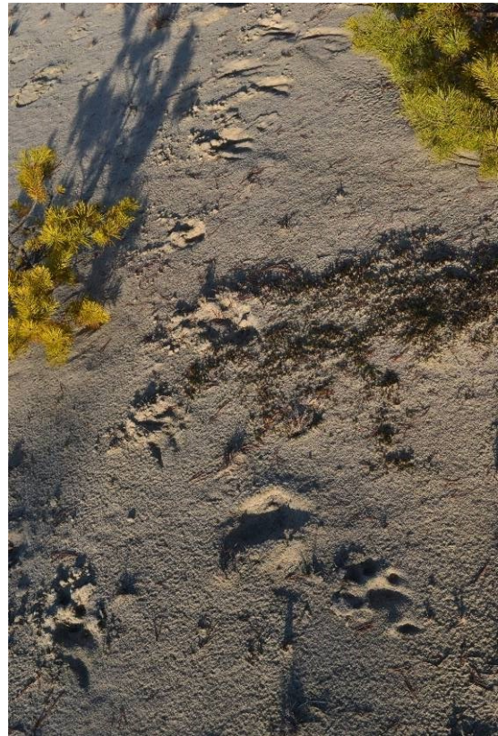
Рис. 5. Рідкісний тип територіальної мітки дорослим самцем. Рись у стрибку зробила на піску подряпини навколо сосни, де постійно лишала ольфакторні мітки.