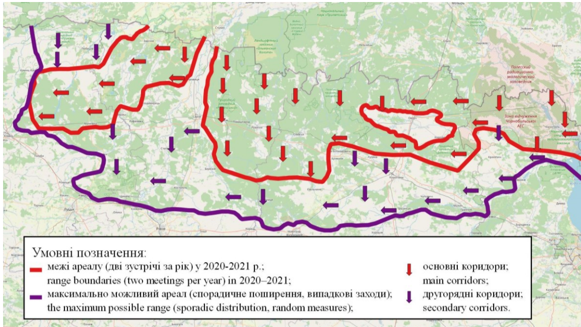
Рис. 13. Межі ареалу 2020–2021 рр. та максимально можливий ареал рисі у Центральному та Західному Поліссі України.