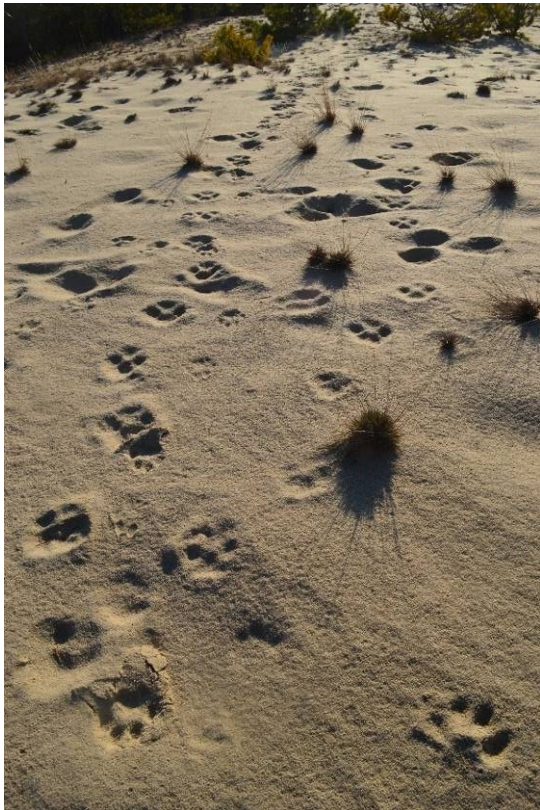
Рис. 4. На верхівках піщаних гряд і в деяких інших місцях можна відшукати «рисячі стежки» зі слідами окремих особин родинного угруповання різної давності. Це найбільш інформативні місця для картування окремих родинних груп.