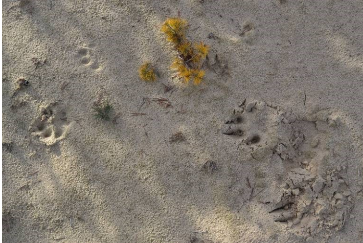
Рис. 3. Сліди територіальної особини рисі, котра лишила відчутну для людини запаху мітку на маленькій пригніченій сосні піщаного пагорбу, випускала кігті та полишила слабкі подряпини на піску.