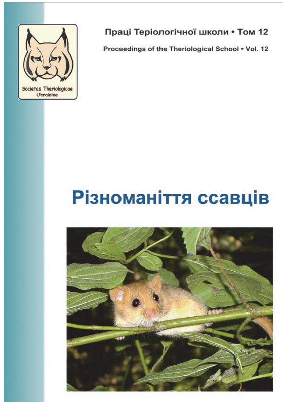
Рис. 1. Обкладинка «Праці Теріологічної школи», том 12; автор фото — Г. Зайцева-Анциферова.