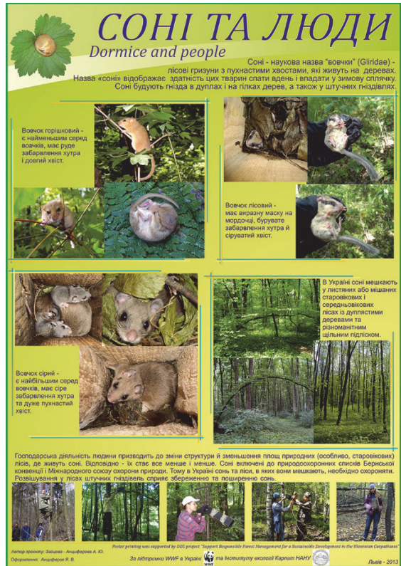
Рис. 2. Плакат «Сони та люди»; автор — Г. Зайцева-Анциферова.