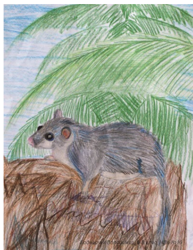
Рис. 5. Дитячий комікс «Супер Соня», автор: С. Мосендз, НВК № 16, м. Кам'янець-Подільський.