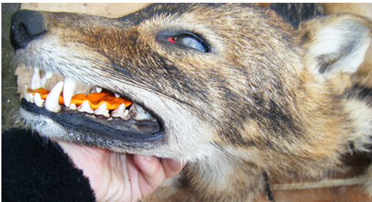
Рис. 1. Голова шакала здобутого біля Тилігульського лиману 22.10.2008 р.

Отримані дані дають підставу говорити про формування осередку розмноження шакалу на материковій частині півдня Миколаївської області в межах Очаківського району. З грудня 2010 р. до грудня 2015 р. там виявлено 43 тварини. Найбільшу зграю, з 9 особин, спостерігали 8.11.2015 р. у пониззях балки Аджигол поблизу с. Солончаки. Зауважимо, що вид знаходиться під значним пресом мисливців, здобуто 34 особини, але чисельність його зростає. В Березанському р-ні виявлено і здобуто лише одну тварину, у 2008 р. Як повідомив нам місцевий таксидерміст, більше фактів здобуття шакалів йому не відомо.