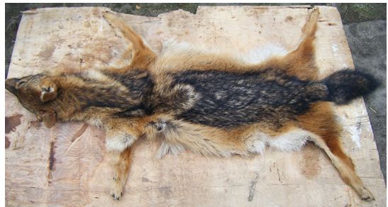
Рис. 2. Шкура шакала, здобутого біля Тилігульського лиману 22.10.2008 р.

Fig. 1. The head of the jackal shot near the Tylihul Estuary on 22.10.2008. Photo by the author.