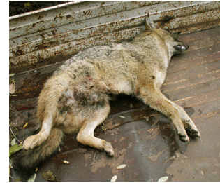
Рис. 5. Шакал, здобутий біля с. Парутине 15.11.2015.

Fig. 4. Jackals shot near Solonchaki on 8.11.2015.