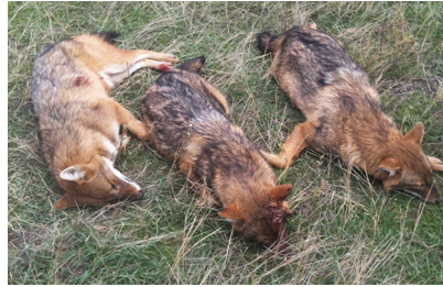
Рис. 4. Шакали, здобуті поблизу с. Солончаки 8.11.2015.

Fig. 3. The jackal shot near Ivanivka on 24.02.2013.