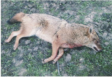
Рис. 3. Шакал, здобутий біля с. Іванівка 24.02.2013.

Fig. 3. The jackal shot near Ivanivka on 24.02.2013.